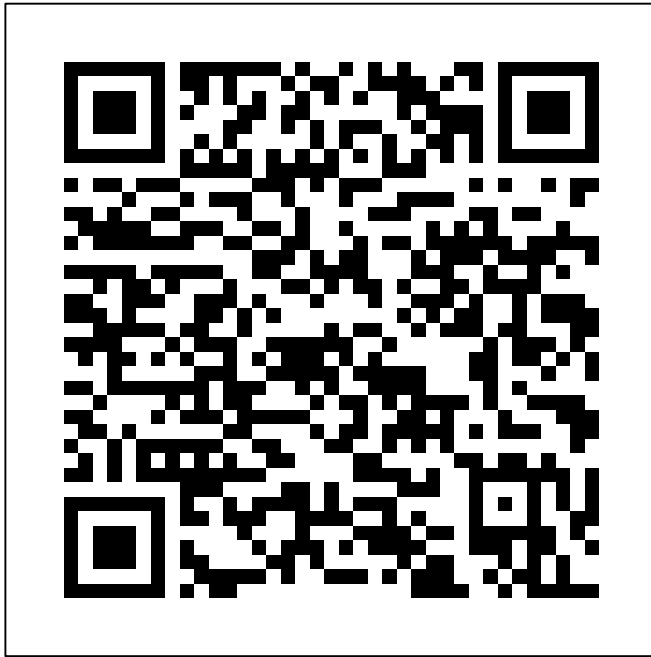
App store - Apple